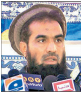
Zaki-ur Rehman Lakhvi

Islamabad: The Pakistan government on Monday failed to file a plea challenging the bail to Zaki-ur Rehman Lakhvi, the key planner of the 2008 Mumbai attack. Meanwhile, Lakhvi filed a petition in the high court against a court's decision to make a judicial panel's record a part of evidence in the 26/11 case. The prosecution, which was supposed to challenge the Islamabad anti-terrorism court's (ATC) decision to grant bail to Lakhvi in the high court, could not do so as it failed to get a copy of