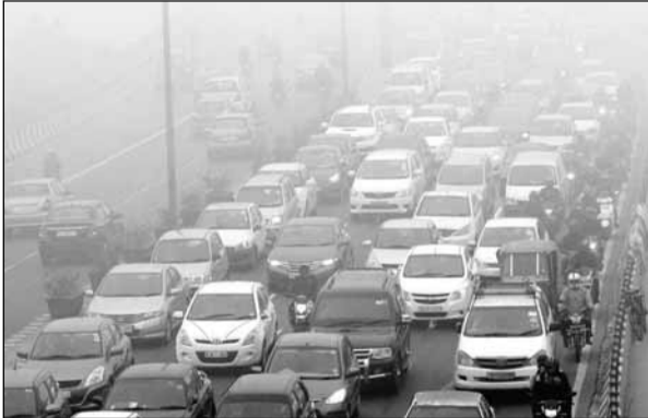
समाजवादी पार्टी द्वारा आयोजित महाधरना के चलते दिल्ली में जगह-जगह जाम लग गया।

नई दिल्ली, (ब्यूरो): दिल्ली में सोमवार को विपक्षी दलों द्वारा आयोजित महाधरना के चलते दिल्ली की रफ्तार थम गई। नई दिल्ली, मध्य दिल्ली, पूर्वी दिल्ली व दक्षिणी-पूर्वी दिल्ली के मार्गों पर कई किलोमीटर लम्बा जाम लगा रहा। जाम को खोलने में यातायात पुलिसकर्मियों को कड़ी मशक्कत करनी पड़ी। सोमवार को कार्यदिवस होने के चलते लाखों की तादाद में